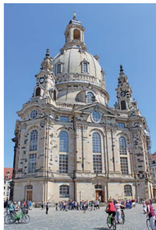
Die Dresdner Frauenkirche – Monument und Mahmal.