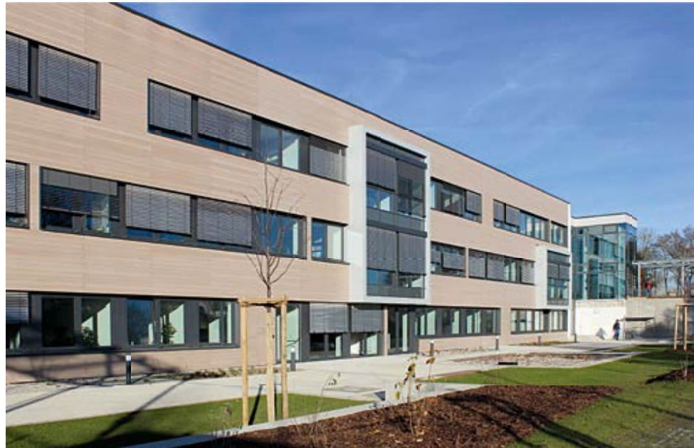
Das neue Kompetenzzentrum Tier in Grub

Insgesamt neun in den Bereichen Rinder, Schweine, Schafe, Ziegen und Geflügel bayernweit agierende Ver-