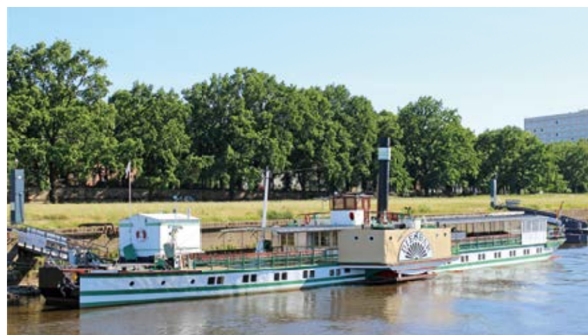
Mit der sächsischen Dampfschiffahrt konnten wir das Elbflorenz vom Fluß aus bewundern.