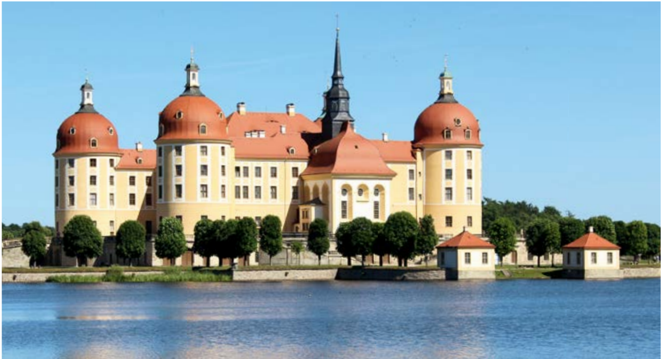
Die Moritzburg – märchenhafte Kulisse, nicht nur im Film.

Unsere diesjährige Studienfahrt führte uns am 01. und 02.06.2017 zusammen mit 34 Teilnehmern für 2 Tage nach Dresden, dem Elbflorenz. Hier ein paar Eindrücke unserer Kurzreise.