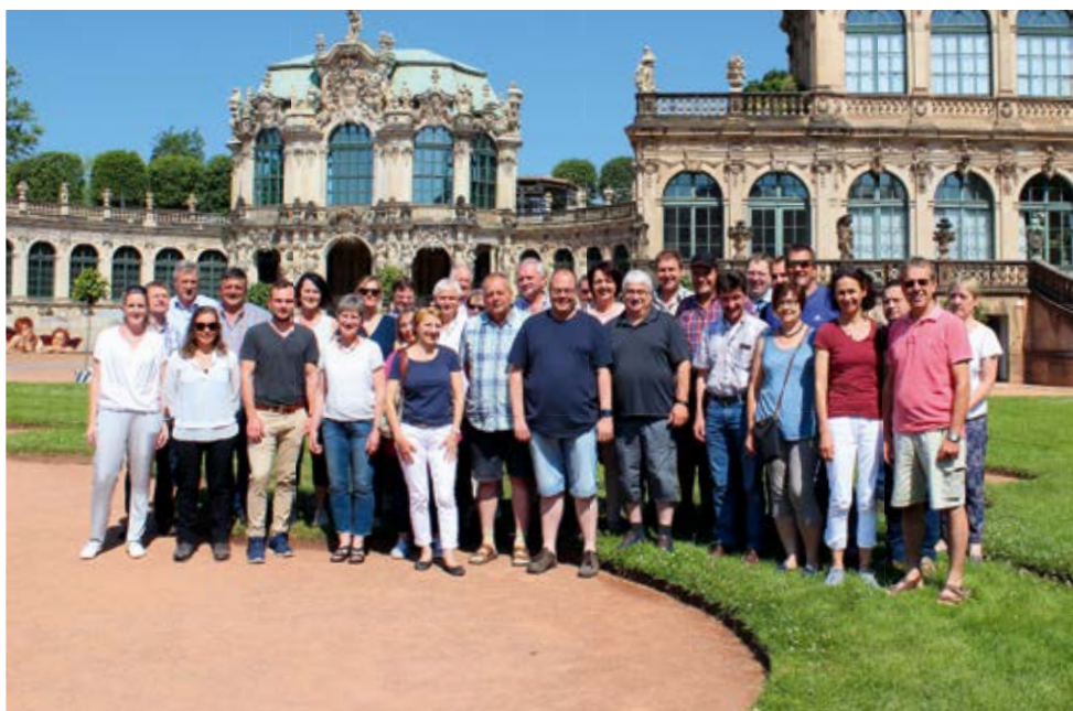
Im Dresdner Zwinger leben die glanzvollen Zeiten des Barock weiter.

Am nächsten Morgen starten wir mit dem Bus zu einer Stadtführung, bei der wir immer wieder die Elbe kreuzen und so verschiedenste Stadtteile sehen. Die zweite Hälfte der Tour begehen wir dann zu Fuß. Besonders beeindruckend ist die in großen Teilen rekonstruierte und durch verschiede-